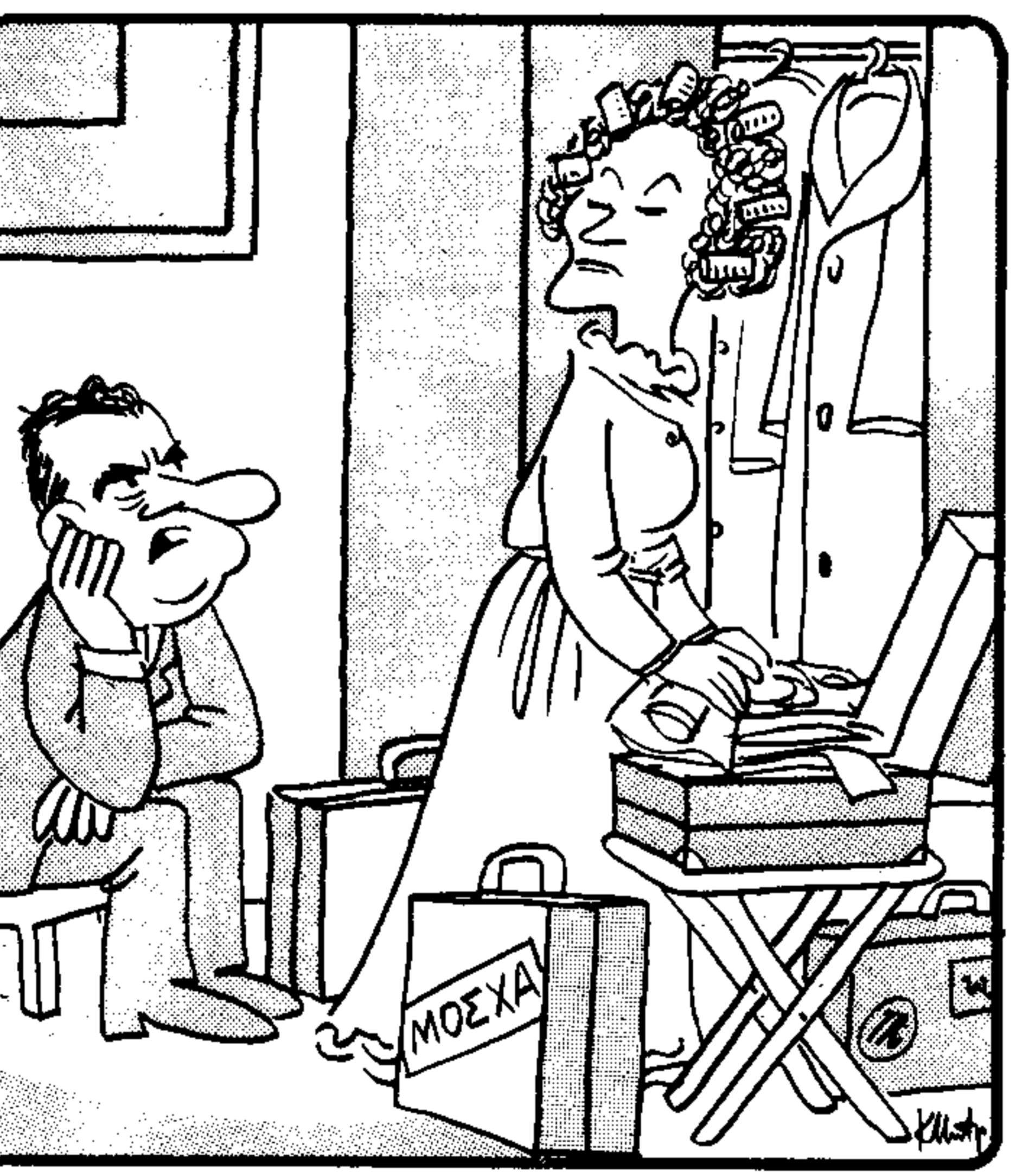
— Προβλέπεται υποχρά ύποδοχή, Πατριτίσα. Πάρε καμιά γούνα μαζί... (Τού Κάστα Μπέρτσουλου)

Φεύγει τό πρωτό τό Σάββατο, με προορισμό τή Μόσχα ο πρόεδρος Νίξον, άπαγγιτών, ο νεωρό έπίσκοπότη του Λευκού Οίκου, που τό έκανε αχτιική ερώτηση. Είναι ή πρώτη φορά που ο Άμερικανός πρόεδρος προωπαικί έπίθεδαίνεϊ ότι τό ταξίδι του στη Μόσχα θά πραγματοποιηθή, παρά τήν κάποιε ένταση που παρατηρείται στις σχέσεις Άμερικής και Ρωσίας, λόγω τής κλιμακώσεως του πόλεμου τό Βιετνάμ.